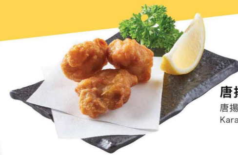
唐揚げ(3ヶ) 唐揚雞(3件) Karaage (3pcs)