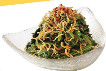
ほうれん草のおひたし 芝麻菠菜 Spinach with Crispy Fish