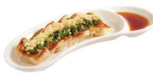
一風堂餃子 一風堂餃子 IPPUDO Gyoza 6ヶ/件/pes $40 10ヶ/件/pes $58