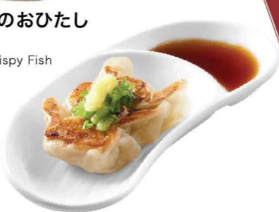
一風堂餃子(3ヶ) 一風堂餃子(3件) IPPUDO Gyoza (3pcs)