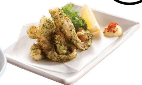
イカゲソ磯辺揚げ 炸紫菜墨魚觸 Deep-fried Cuttlefish Tentacles with Seaweed Flavor