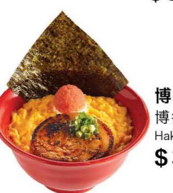
博多めし(小) 博多飯(細) Hakata-style Rice (Small) $35