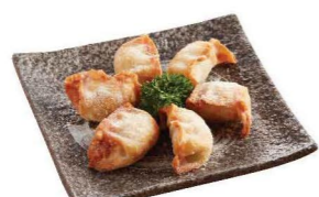
揚げ餃子 コーンポターージュ味 粟米濃湯風味炸餃子 Corn Portage Flavoured Deep-fried Gyoza 6ヶ/件/pes $42 10ヶ/件/pes $58