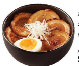
半熟煮玉子と炙り チャーシュー丼 炙燒豚肉半熟玉子飯 (特製濃厚燒肉汁使用) Aburi BBQ Pork Rice with Soft Boiled Egg $68