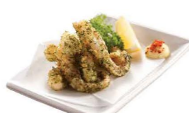
イカゲソ磯辺揚げ 炸紫菜墨魚觸 Deep-fried Cuttlefish Tentacles with Seaweed Flavor $35