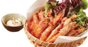
海老の丸ごと唐揚げ 唐揚海老 Karaage Shrimps $48