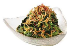
ほうれん草のおひたし 芝麻菠菜 Spinach with Crispy Fish $28