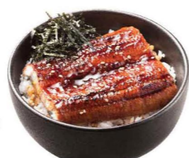
うな丼 鰻魚飯 Grilled Eel Rice $98