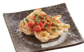
一風堂餃子 サルサソース 一風堂餃子配莎莎醬 IPPUDO Gyoza with Salsa Sauce 6ヶ/件/pes $45 10ヶ/件/pes $60