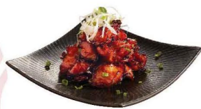
鶏ハラミの唐揚げ 炸雞外橫隔膜 Deep-fried Chicken Harami $32