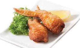
手羽先明太子 明太子雞翼 Chicken Wings with Cod Roe $35